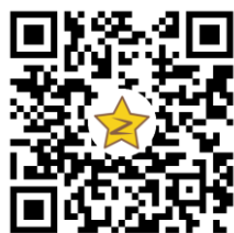
基金会 QQ 空间