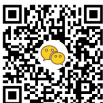
基金会微信公众号